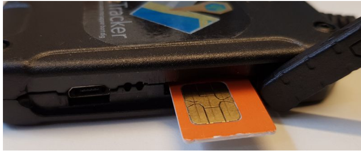
ezTracker Fordon G2