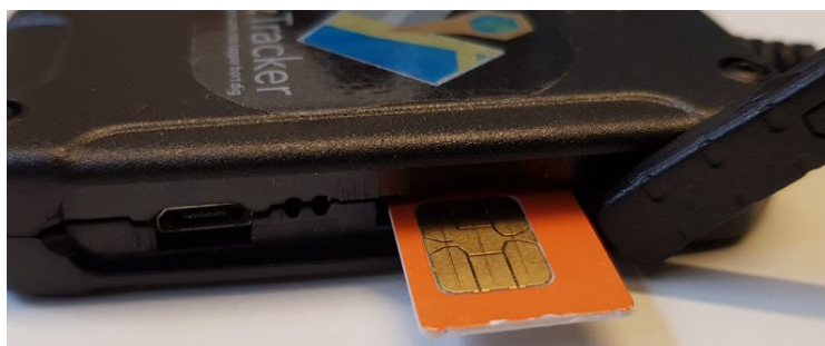
ezTracker Fordon G2