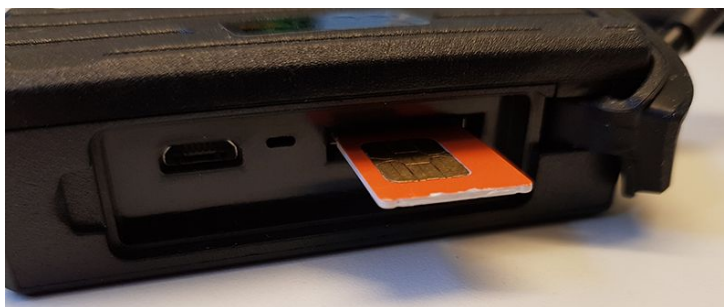
ezTracker Fordon G1

Man kan behöva använda en nagel eller t.ex. kanten av kortet SIM-kortet kom i för att klicka in SIM-kortet korrekt. När kortet är korrekt lyser den gröna och blåa dioden bredvid.